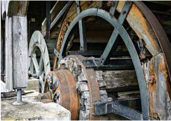
Einst vom Wasserrad angetrieben: das Walliser Hammerwerk.

Es würde zu weit führen, an dieser Stelle all die Gegenstände aufzuführen, die im Museum zu sehen sind. Zum Inventar gehört eine funktionstüchtige Esse, welche bei Führungen in Betrieb genommen wird. Hammer und Amboss gehören ebenso zur Ausstellung sowie unzählige andere Werkzeuge. Zu bestaunen sind ebenfalls eine Gesenkpresse aus dem Jahr 1850 und ein 16 000 Kilogramm schwerer Gesenkschmiedehammer aus dem