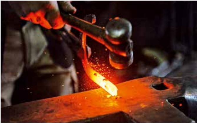
Faszinierendes Schauspiel – das Klingeln des Metalles und der Geruch von warmem Eisen.