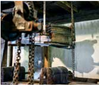
Auch der Blasbalg hat früher seinen Zweck erfüllt.

Schmiede über ihre breiten Schultern schauen und zeigen den Besuchenden die Kunst des Schmiedehandwerks. Die Ahnen- und Raritätenstube öffnet den Blick in eine Familiengeschichte über sechs Generationen.