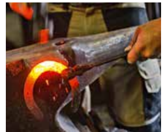
Eisenglühwunder – es muss schnell gehen, das Schmieden.